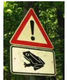
Verkehrsschild mit Hinweis auf Amphibienwanderung

sein. Aber auch zeitlich begrenzte „ Krötenzäune “ aus Plastik, an denen die wandernden Tiere entlanglaufen, bis sie in Sammeleimer fallen und von menschlichen Helfern über die Straße getragen werden, sind eine häufig genutzte Möglichkeit. Manche Straßen werden während der Hauptwanderung auch für Fahrzeuge gesperrt. Ersatzlaichgewässer anzulegen ist eine weitere Alternative, jedoch müssen diese Gewässer von den ortstreuen Amphibien erst einmal akzeptiert werden.