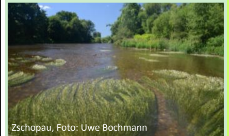
Zschopau, Foto: Uwe Bochmann