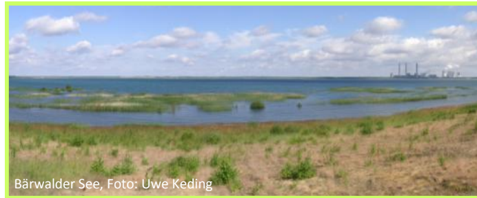
Bärwalder See