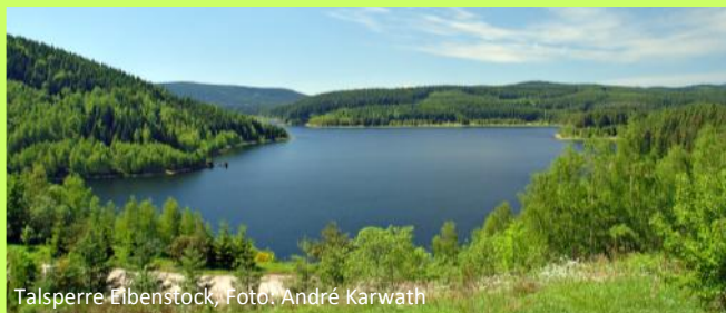
Talsperre Eibenstock