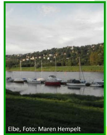
Elbe, Foto: Maren Hempelt